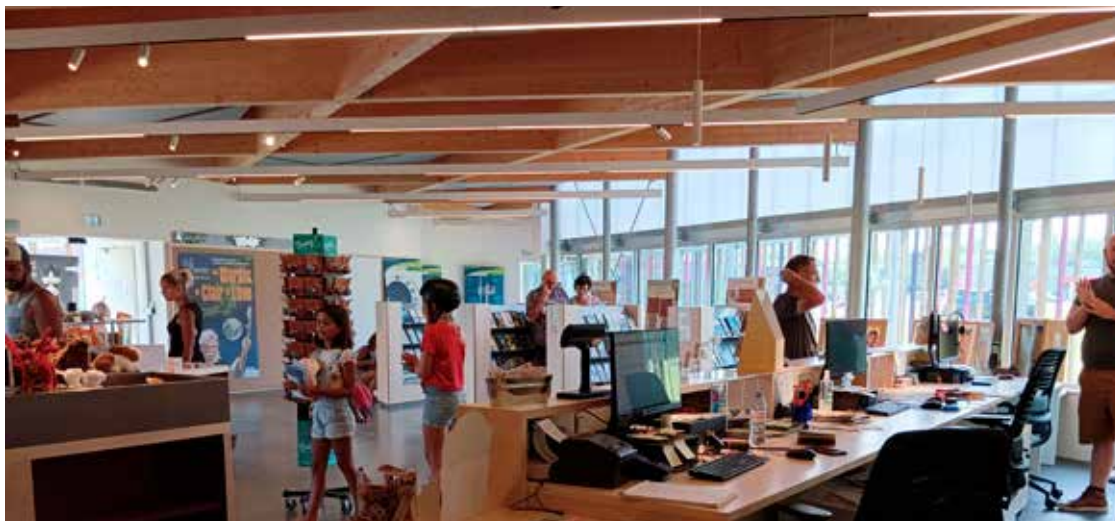
Nouveau siège de l'Office de Tourisme à Poulô, un accueil cous'humain !

La politique touristique propose une large gamme d'événements et d'animations toute l'année, à des prix accessibles. Particularité de l'OT Falaises d'Armor, la boutique à Lanvollon est une vraie boutique, avec une offre de 500 articles représentatifs du territoire, de préférence locaux : plein air, nature, histoire, culture, décoration, légendes... Des cadeaux souvenirs bien sûr, mais aussi des objets utiles. Nos critères de sélection sont la qualité et le sens, en adéquation avec les valeurs de notre territoire engagé. ▬