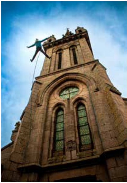
Descente en rappel des clochers de Leff Armor

D e nouveaux projets ambitieux sont en cours de développement, principalement dans le domaine du patrimoine immatériel. Sans trop en dévoiler, voici quelques thématiques à l'étude : « l'Ankou » (la mort), Moyen-Âge, activité immersive en forêt, bains nordiques, éoliennes et vent... À découvrir dans les mois qui viennent !