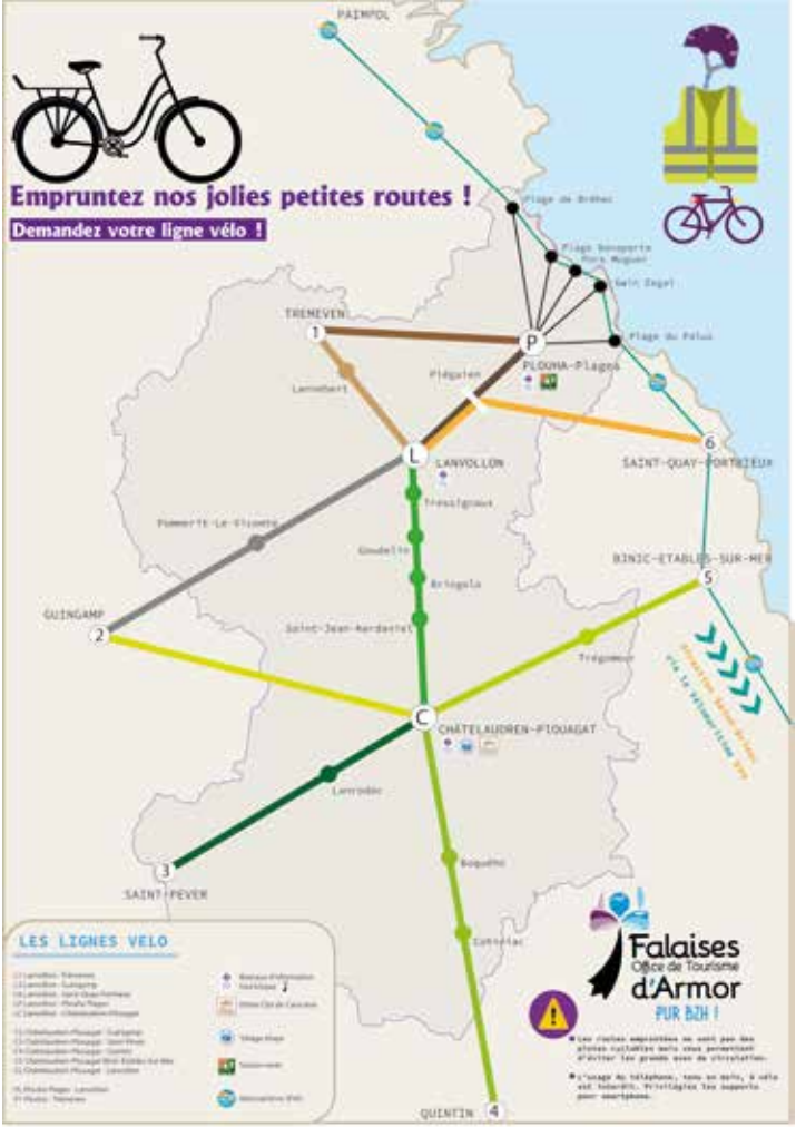
Depuis 2023, demandez votre plan lignes vélo à l'Office de Tourisme.