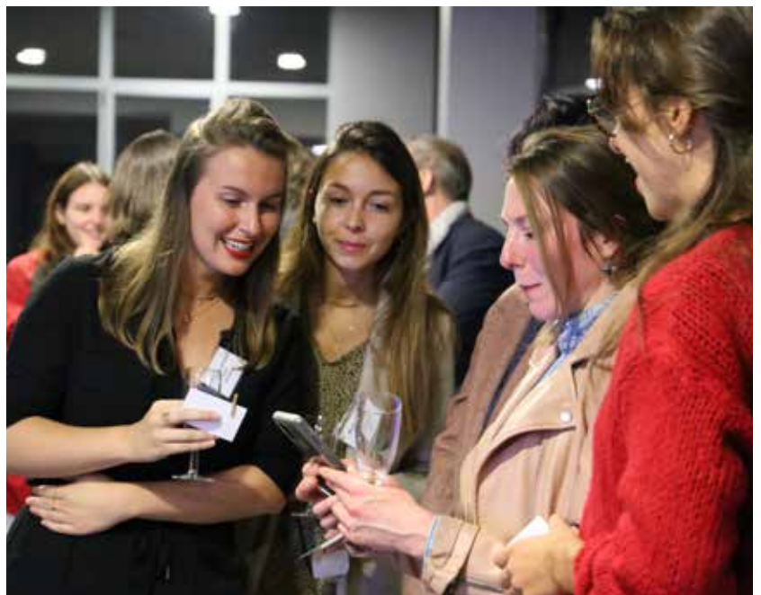
Deuxième soirée de bienvenue aux internes, Le Petit Écho de la Mode, novembre 2022.

Deux temps de sensibilisation à la Maîtrise de Stage ont été menés (en 2019 puis en 2021). Ces rencontres ont déjà contribué à leur niveau, à l'engagement de plusieurs médecins du territoire. Une première formation délocalisée à Saint-Brieuc a eu lieu les 13 et 14 octobre dernier.