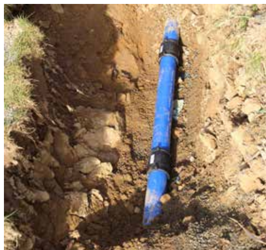
Réfection de conduite d'eau