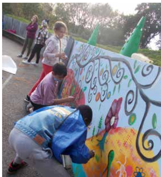
Enfance-jeunesse : réalisation de la fresque murale à Blanchardeau (photo d'archive - 2021)