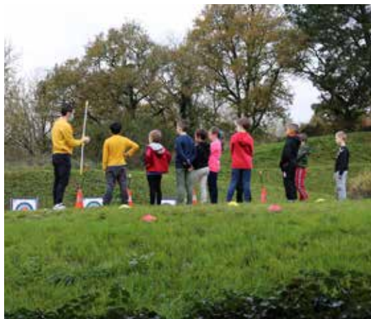
Services à la population - ALSH : Initiation Tir à l'arc

L'économie sociale et solidaire sera le fil directeur du projet de réhabilitation du site de Coat An Doc'h. Le site réhabilité a vocation à devenir un lieu mutualisé d'expérimentation qui accueillerait des entreprises, activités et services liés aux domaines de l'économie circulaire et du réemploi. Cet espace serait aussi dès 2023 et le début des travaux, un lieu de formation dédié à l'éco-réhabilitation.