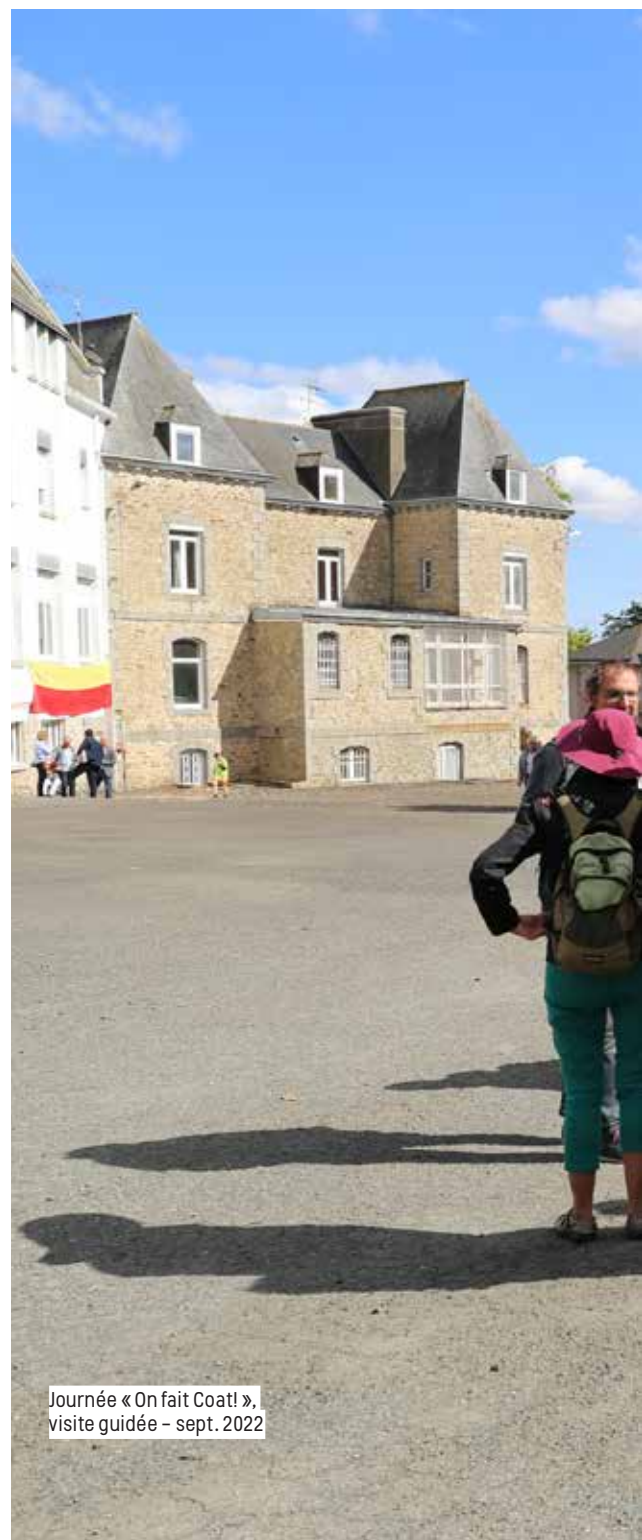
Journée « On fait Coat! », visite guidée – sept. 2022