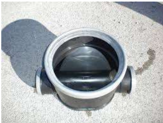
Schéma d'une boite de branchement eaux usées

- Le regard est installé de préférence en limite de propriété sur le domaine public, de manière à être facilement accessible pour les entretiens et l'exploitation et ainsi à ne pas vous déranger.